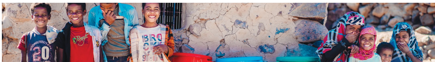
Vodné filtre poskytujú komunitám čistú vodu, Jemen.

Je nevyhnutné, aby médiá prioritne informovali o krízach, v ktorých existuje veľká núdza, aby sa tieto krízy ďalej nezanedbávali. Médiá pôsobia ako katalyzátor pri získavaní pozornosti. Bez tejto pozornosti je získavanie finančných prostriedkov ťažšie, chýba politická vôľa riešiť zložité situácie a cirkvi a široká verejnosť nesústreďia svoje modlitby a dary na zmiernenie utrpenia postihnutých. Čitatelia sa tiež musia naučiť všímať si aj krajiny, ktoré nie sú uvedené na titulných stránkach novín, ktorým sa venuje málo pozornosti, ale trpia veľkou núdzou. Keďže sme všetci stvorení na Jeho obraz, vieme, že v Božích očiach by nikto nemal byť považovaný za "zabudnutého" - a nemal by byť ani v našich.