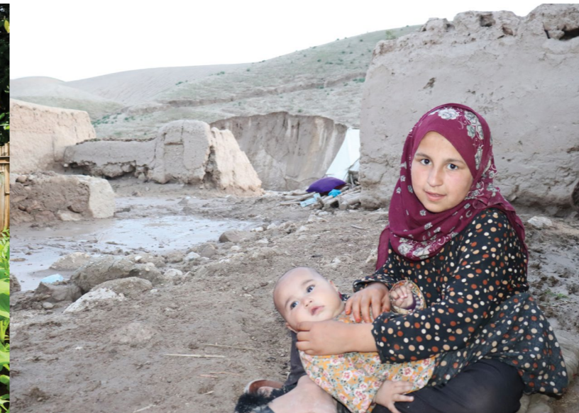
Dve sestry sedia na mieste, kde stál ich rodinný dom pred tým, ako ho zničili bleskové záplavy, Afganistan.