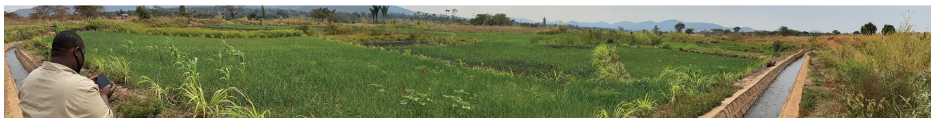
Táto pôda bola náchylná na suchu a záplavy, ale vďaka novému zavlažovaciemu systému je pôda chránená a môže priniesť tri úrody za rok, Konžská demokratická republika.

Päť záväzkov Aliancie Integral a vyhlásenie o lokalizácii nájdete tu: https://integralalliance.org/about/localisation