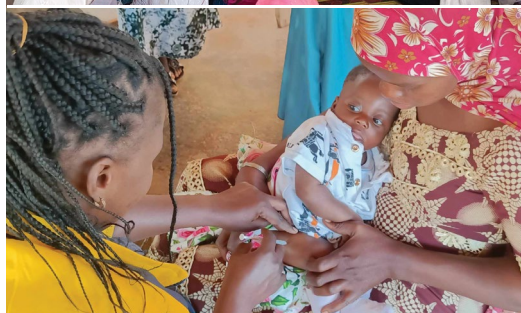
Odhora nadol: Tieto matky išli tri dni pešo, aby našli vodu po troch vynechaných obdobiach dažďov, Etiópia. Deti z menšinových skupín a deti so zdravotným postihnutím sa vzdelávajú. Očkovacia klinika, Burkina Faso.