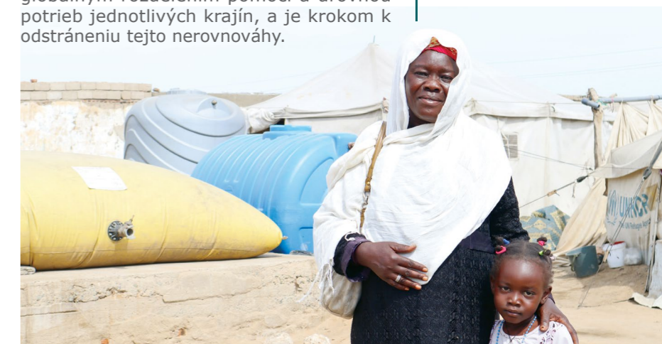
Lokálne iniciatívy podporujú ľudí vysídlených v dôsledku vojny, Sudán.

Zakladateľka Inštitútu pre štúdium ázijských cirkví a kultúry a globálna veľvyslankyňa Micah