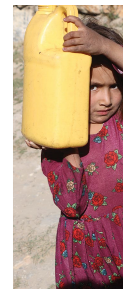
Aj od malých detí sa očakáva pomoc pri domácich prácach, Afganistan.

riaditeľ pre medzinárodnú spoluprácu, Mission East