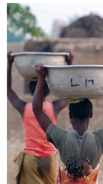
Dievčatá nesúce vodu zo studne v dedine, Burkina Faso.